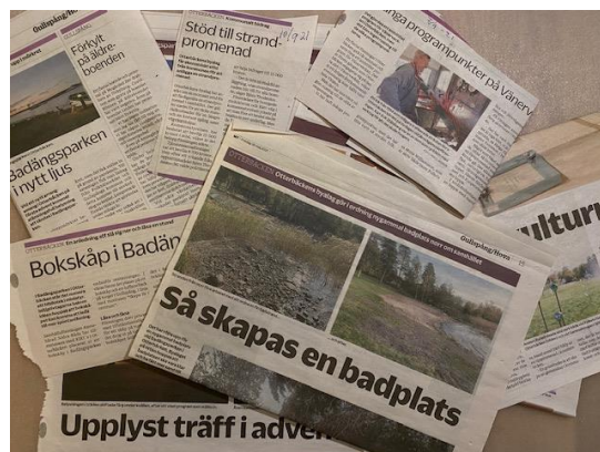
Under året 2021 har Otterbäckens Byalag omnämnts i Mariestads-Tidningen vid fem tillfällen

Årets aktiviteter presenteras i medlemsutskick med post i början på året. Styrelsens sekreterare framställer affischer inför varje aktivitet som sätts upp på anslagstavlor i närområdet samt annonseras i Mariestads-Tidningen. Till de medlemmar som har mejl