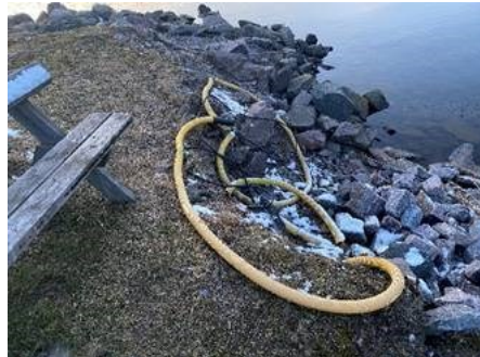
Bortkopplad elkabel som matade el till fyren