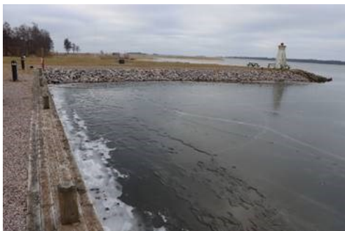
Bild på den östra kajen samt den provisoriska slänt som ersatt den rasade kajen.